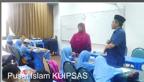
Pusat Islam KUIPSAS